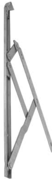
COMPASSO PROJECTANTE INOX 304

COMPASSO PROJECTANTE PROJECTING COMPASS COMPÁS PROYECTANTE COMPAS DE PROJECTION