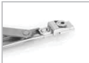
AP23 Regulador de fixação